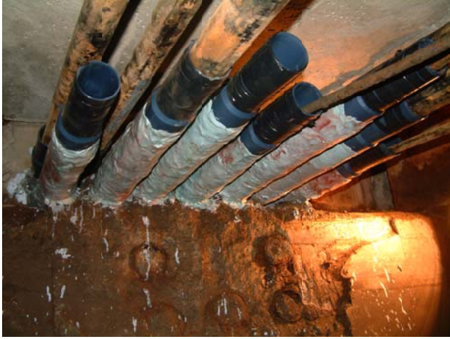
スリーブボンド2083で鋼管を防食