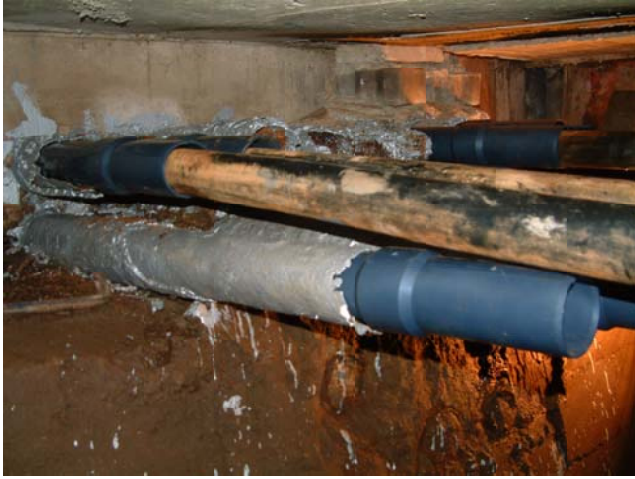
スプリット・レジュースー R 施工状況写真