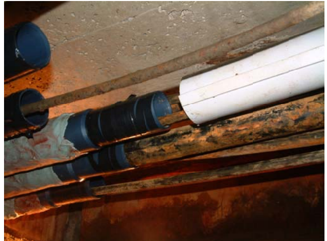
スプリット・ダクト設置